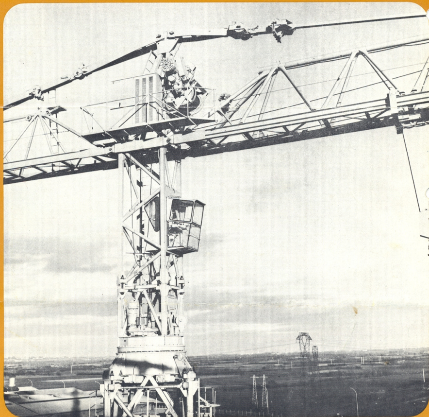
Ref. : 3300-01-A

GRUES AUTOMONTABLES SELF-ERECTING CRANES SELBSTMONTIERBARE KRANE GRUAS AUTOMONTABLES