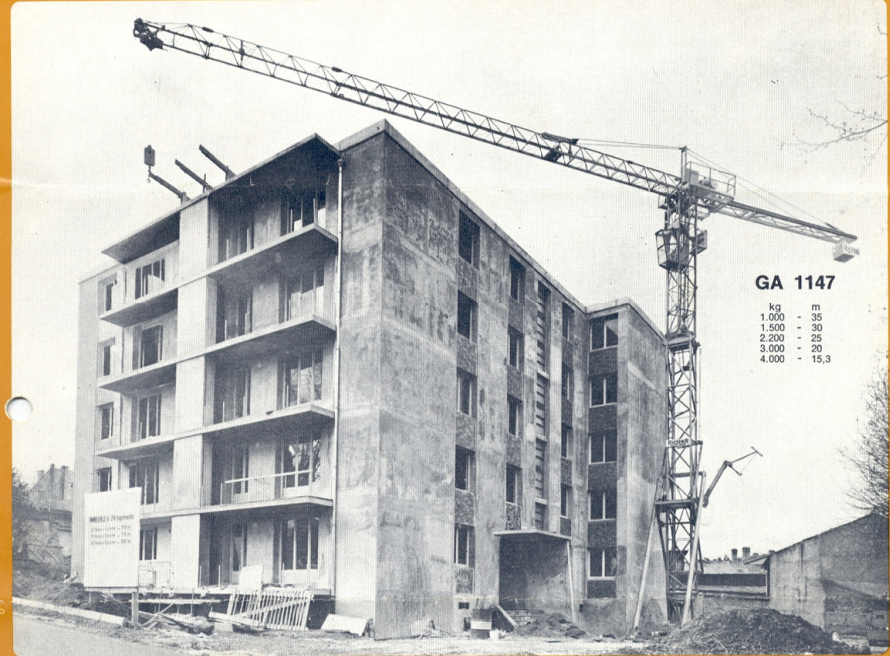
GA 1147 kg m 1.000 - 35 1.500 - 30 2.200 - 25 3.000 - 20 4.000 - 15,3