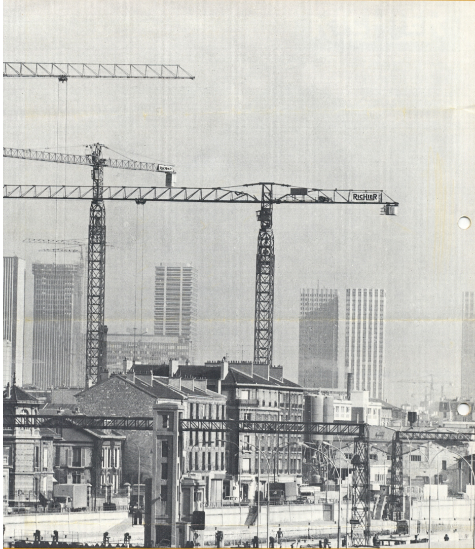
GT1174B GT1184B GT1194B GT1295E GT1361B GT1372B GT1372C GT1425G GT1427 GT1450